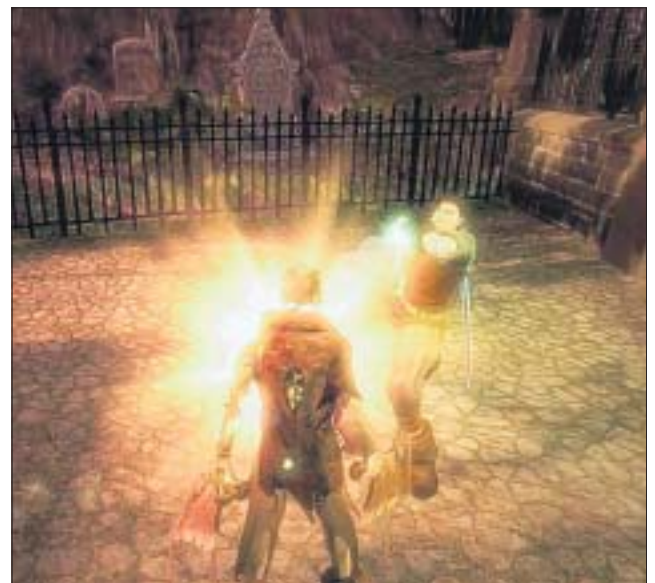
« Fable II », l'aventure continue du côté d'Albion...

«Un beau jeu d'aventures, pour Pierre, de Freeplays. Ça rappelle Zelda, c'est un jeu simple d'accès et qui propose de nombreuses possibilités d'actions. En plus, il y a une très belle ambiance» ●