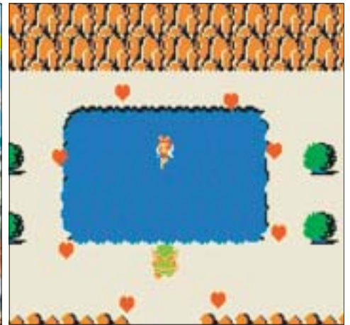
« Donkey Kong », « Super Mario world », « Street fighter II » et « The legend of Zelda » : toute une époque... pas tout à fait révolue.